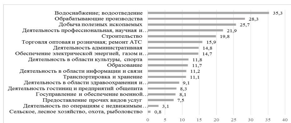
Рис. 2. Фактическая налоговая нагрузка по экономической деятельности Чувашской Республики в 2019 г., %

Как видно из представленного рисунка 2, значительное налоговое бремя несут такие виды деятельности, как обрабатывающие производства, строительство, добыча полезных ископаемых. Итак, и в структуре ВРП, и в структуре налоговых платежей лидируют такие виды деятельности, как обрабатывающие производства и торговля. При этом, наблюдается явное несоответствие по структуре ВРП и уровню налоговой нагрузки — сельскохозяйственная деятельность занимает четвертое место по доле ВРП и последнее место по уровню налоговой нагрузки. Сельскохозяйственная отрасль обеспечила всего 0,4% мобилизованных налоговых доходов в Чувашии.