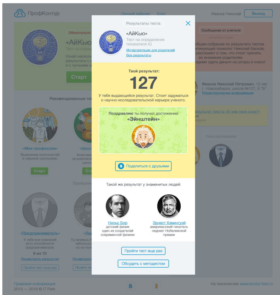
Рис. 3. Вывод результата для респондента

ствуют интерпретации для родителей, которые помогут как самостоятельно, так и при помощи психолога школы лучше понять своего ребенка.