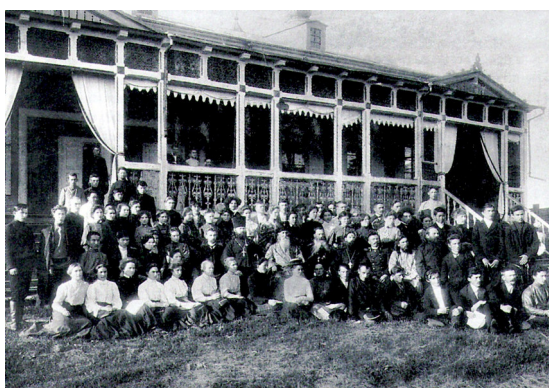
Иркутский архиерейский дом

Посольскому Спасо-Преображенскому и Селенгинскому Свято-Троицкому монастырям: 1) озеро Котокель; 2) река Турка на 12 верст от устья; 3) река Каточик, р. Исток; 4) Посольский сор с речками Большая, Абрамиха и Култушная; 5) Каргинский сор (Истокско-Истоминский), находящийся в фактическом ведении Посольского женского монастыря. До 1864 г. сором владели местные крестьяне, затем по неизвестной причине он отошел монастырю; 6) 7 статей по Селенге.