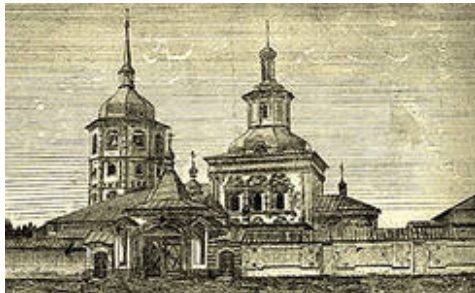
Иркутский Знаменский монастырь