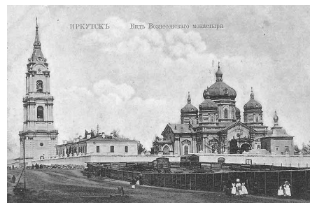
Иркутский Вознесенский монастырь