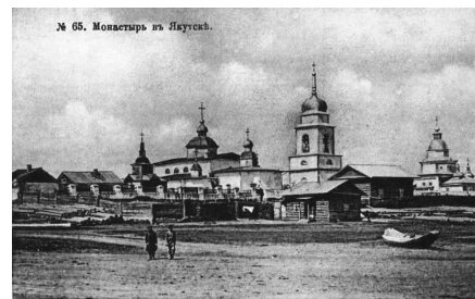
Якутский Спасский монастырь