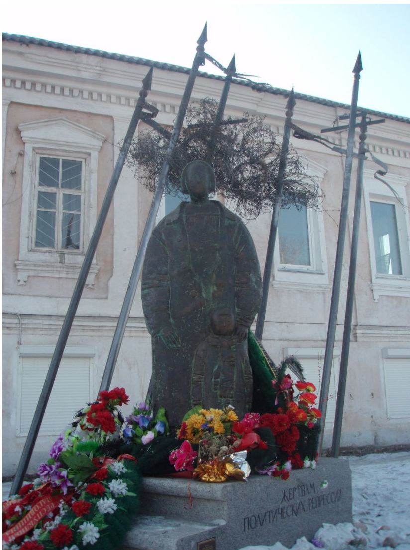
Рис. 3. Памятник жертвам политических репрессий на улице Л. Линховоина