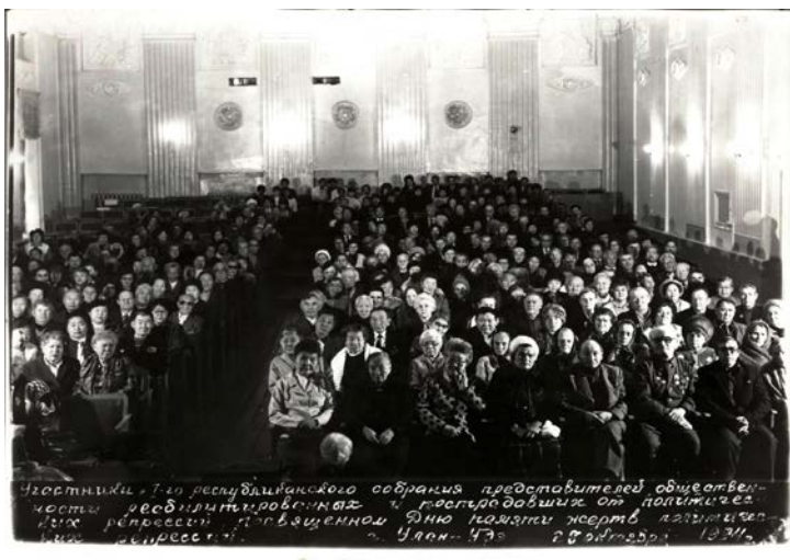
Рис. 1. Собрание представителей общественности реабилитированных и пострадавших от политических репрессий, посвященное Дню памяти. Улан-Удэ, 28 октября 1994 г.