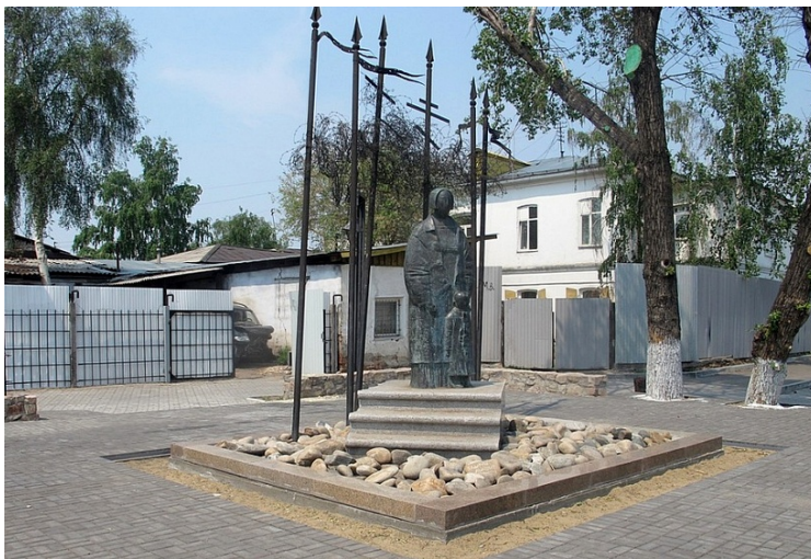
Рис. 4. Памятник жертвам политических репрессий на пересечении улиц Соборная и Коммунистическая (с 2015 г.)