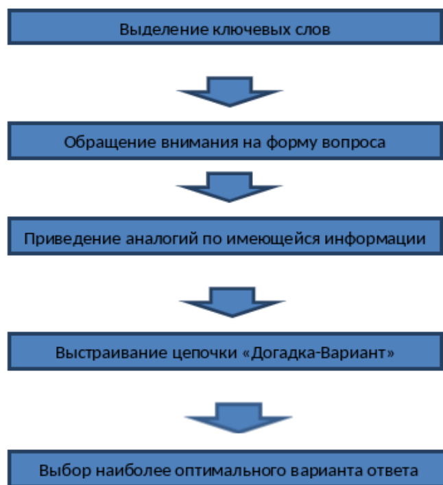
Рис. 1. Алгоритм мыслительных действий

для разгадки вопросов ЧГК. Также эти вопросы характерны тем, что для того чтобы ответить на них, недостаточно одного мыслительного действия.