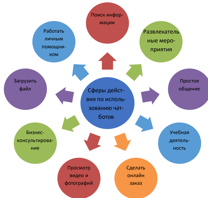
Рис. 1. Области использования чат-ботов

ские решения книгам. Поэтому необходимо оптимизировать тренировочный процесс поколения Z.